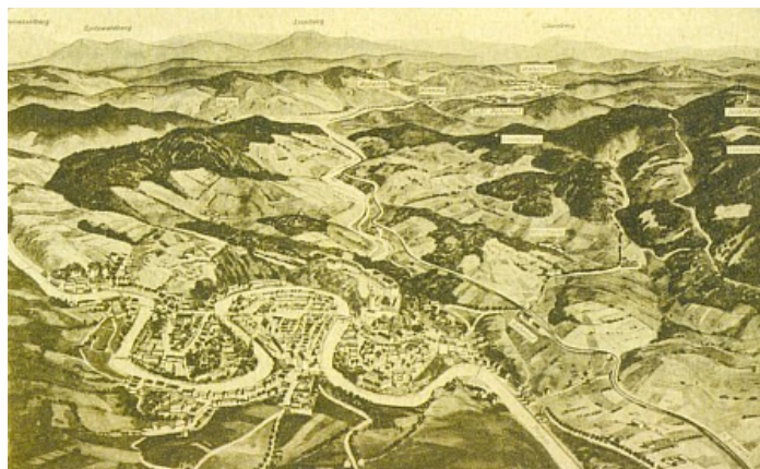
Krumlov na panoramatické pohlednici zachycující říční meandr