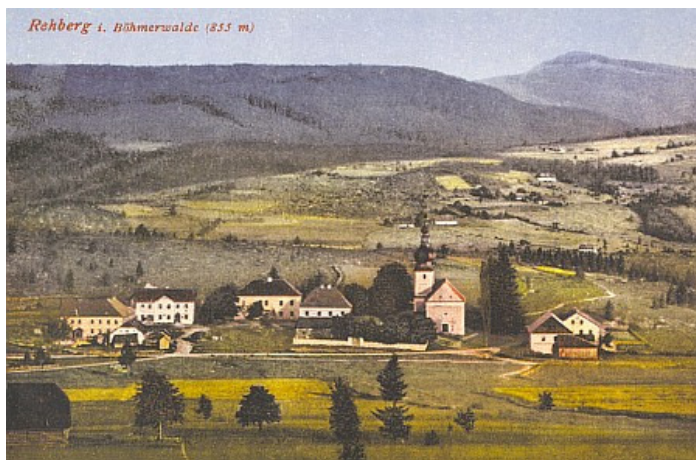
Šumavské Srní na staré pohlednici