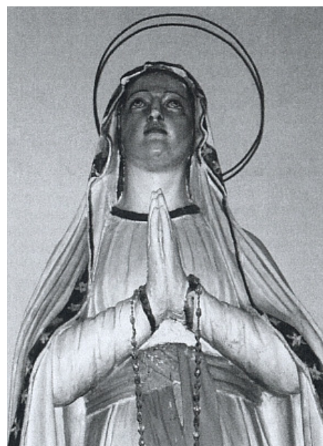
Repro A. Urban - H. Sochor, Grenzüberschreitende Wallfahrten : Unterwegs in Bayern, Böhmen und

Repro Glaube und Heimat, 1993, č. 8, s. 37