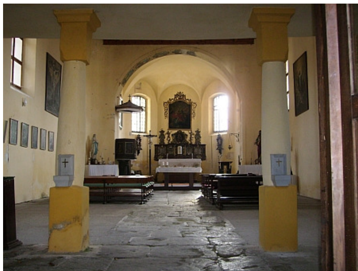
Vnitřek kostela v Srní na fotografii z roku 2008, kde je ovšem Madona z Hauswaldské kaple na bočním oltáři nalevo