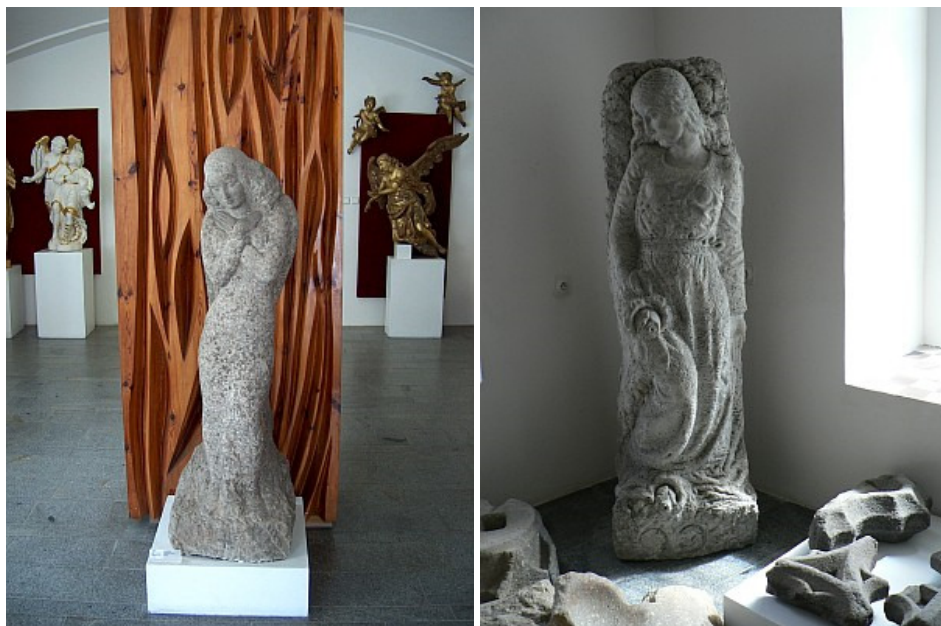
Plastiky ze hřbitova v Srní, dnes umístěné v kašperskohorském Muzeu Šumavy