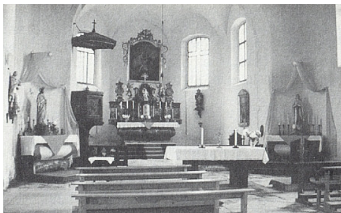
Interiér farního kostela v Srní, vpravo na mariánském oltáři trůní Madona ze zbořené Hauswaldské kaple, kteréžto soše, ačkoli je zhotovena z porcelánu, byla při vyhození objektu do povětří toliko údajně jen zlomená pravá ruka